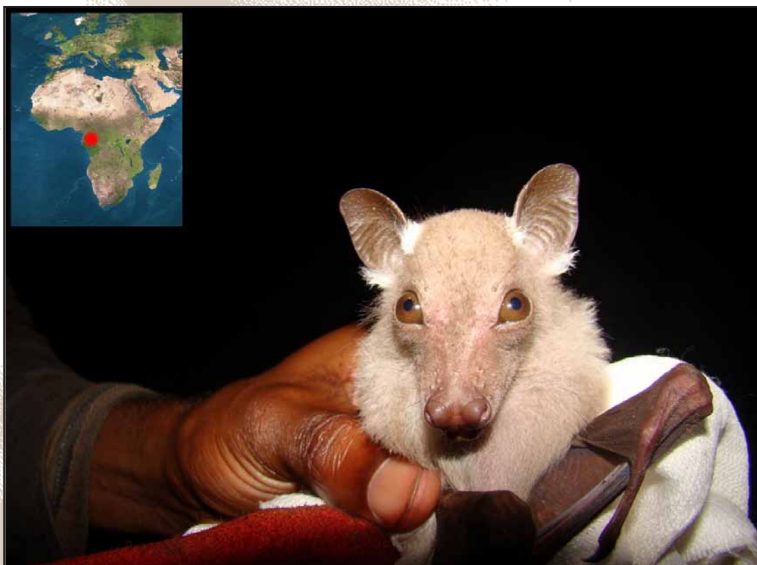
Epomops franqueti.