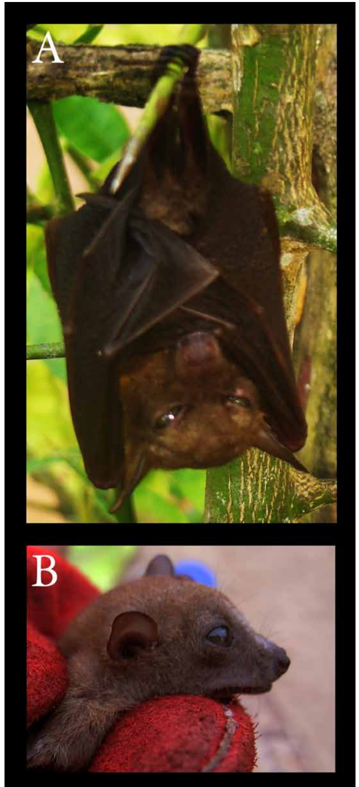
Figure 2 : A : Megaloglossus woermanni , Réserve du Dja ; B : Myonycteris torquata , Béléh (Moloundou).

Ce groupe de chauves souris est le plus diversifié mais le moins abondant (abondance relative) dans la réserve du Dja. Ainsi les 21 espèces capturées ne sont pour la plupart que faiblement représentées (Tableau 1). En plus des captures au filet, plusieurs abris diurnes ont été localisés : une colonie d'une centaine d'individus d' Hipposideros gigas s'abritait dans le creux d'un arbre ( Terminalia superba ) non loin du village Nsimalen ; deux individus de Nycteris grandis s'abritaient sous un petit pont sur la route d'Ekoum ; deux grottes abritant des colonies d' Hipposideros ruber ont été recensées au rocher de Schwam et sur le bord de la rivière Till.